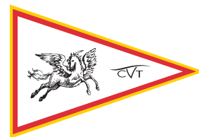
Circolo Vela Toscana