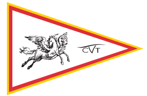
Circolo Vela Toscana